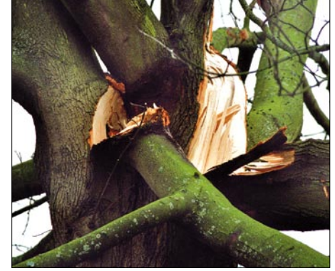
Abb. 5: Großbäume mit derartigen Stammverzweigungen, wie bei diesem Ahorn, werden mit zunehmendem Wachstum bzw. Alter immer problematischer. Es ist ein Fehler der Stadt- bzw. Landschaftsplaner, solche Bäume in Zonen mit starkem Publikumsverkehr zu pflanzen.

Entscheidung spielt es keine Rolle, ob die Zwieselnahrt quer oder längs zur Hauptwindrichtung ausgerichtet ist, denn das Bruchversagen wird durch in Böen entstehende Torsionen ausgelöst, die primär durch horizontal auslegende Kronenteile eingeleitet werden. Welcher Teil der Krone das sein wird und wann das Bruchereignis eintritt, lässt sich nicht konkret vorhersagen (prognostizieren). Mit an Sicherheit grenzender Wahrscheinlichkeit wächst ein derartiger Baum einem Bruchereignis entgegen. Aus diesem Grunde muss gesichert werden.