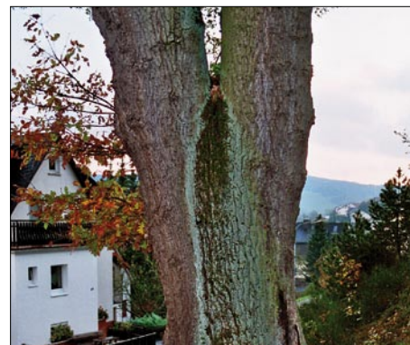
Abb. 1: Stabiler Druckzwiesel an einer über 150 Jahre alten Solitär-Eiche. Ausgeprägtes exzentrisches Dickenwachstum zugunsten der primär druckbelasteten Stämmlingsanbindung ist eine der möglichen Gestaltoptimierungen von Gabelungen, die sich bewährt haben.

der primär druckbelasteten Seiten. Im Gegensatz zum instabilen Druckzwiesel finden sich beim stabilen Druckzwiesel keine die Zwieselnaht verlängernden seitlichen Anbauten (Zwieselohren genannt), ebenso wenig ist eingeklemmte Rinde (Verbindungsfehlstelle) festzustellen. Die beiden zuletzt genannten Merkmale (Phänomene) können u.U. gleichbedeutend mit nicht gegebener Verkehrssicherheit sein.