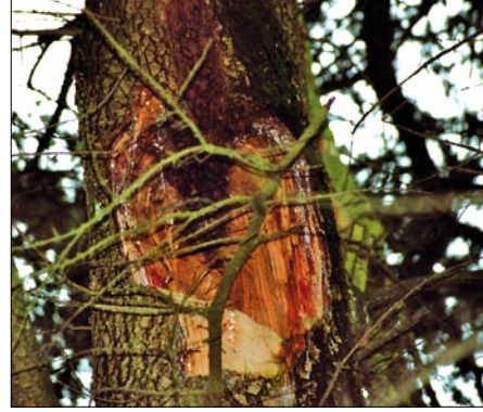
Abb. 4: Zwieselbruch an einer Zeder mit Sachschaden. Hier handelte es sich um eine Gabelung mit eingeklemmter Rinde, ohne Ausbildung von seitlichen Anbauten. Der Zwiesel befand sich in größerer Höhe der Zeder im Zentrum der Krone. Im Zuge einer Regelkontrolle war die Instabilität nicht festzustellen.