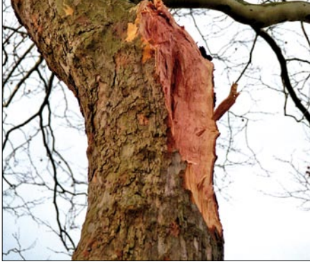
Abb. 3: Freistehend aufgewachsene Bäume sind zumeist so sicher konstruiert, dass sie selbst Starkwindereignisse ohne nennenswerte Verletzungen überstehen. Im Einzelfall kann es jedoch passieren, dass eine mechanisch intakte Gabelung birst: Der Bruch des Zugzwiesels an dieser Platane war nicht vorhersehbar.